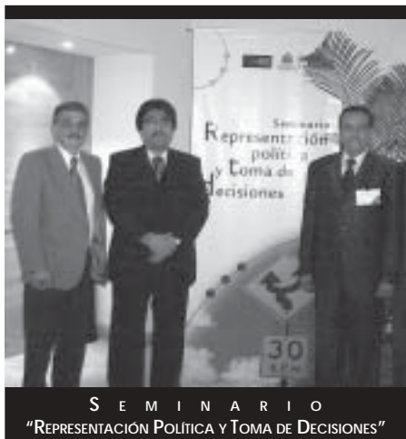
SEMINARIO “REPRESENTACIÓN POLÍTICA Y TOMA DE DECISIONES”